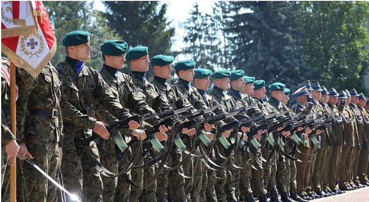
Fot. 2.Ośrodek Radioelektroniczny w Przasnyszu